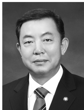
국회 교육위원장 이찬열