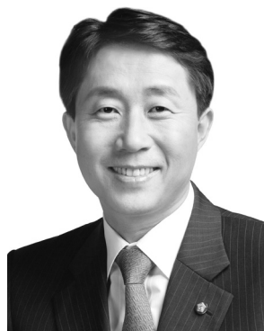
더불어민주당 정책위의장 조정식