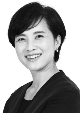
부총리 겸 교육부장관 유은혜