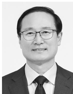
더불어민주당 원내대표 홍영표