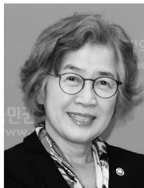
국민권익위원회 위원장 박은정