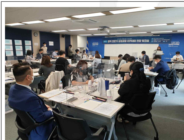
제1기 아카데미 현장 워크숍 강의실 모습