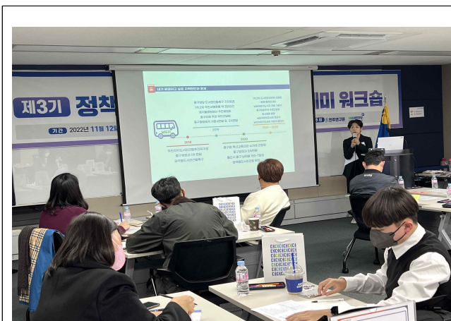
제3기 아카데미 현장워크숍 정책연구과제 발표